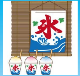
プールサイドカフェ