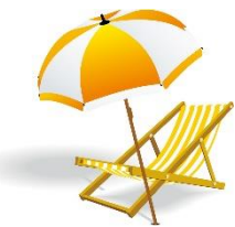
六口島リゾート 象岩亭 天然記念物「象岩」 100mの遠浅です