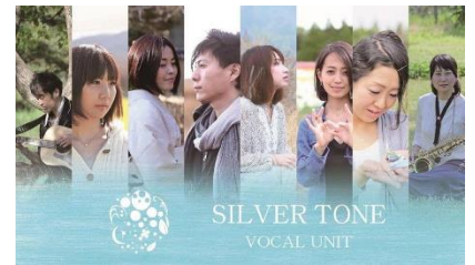
SILVER TONE VOCAL UNIT シルバートーン プールサイドステージ 8月12日, 14日 19:00~19:30