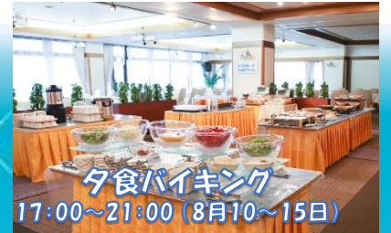
夕食バイキング 17:00~21:00 (8月10~15日)