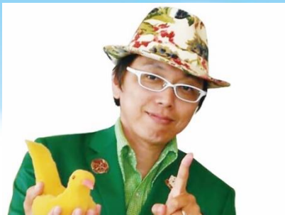
マジックショー 8月13日14日 20:15~21:00