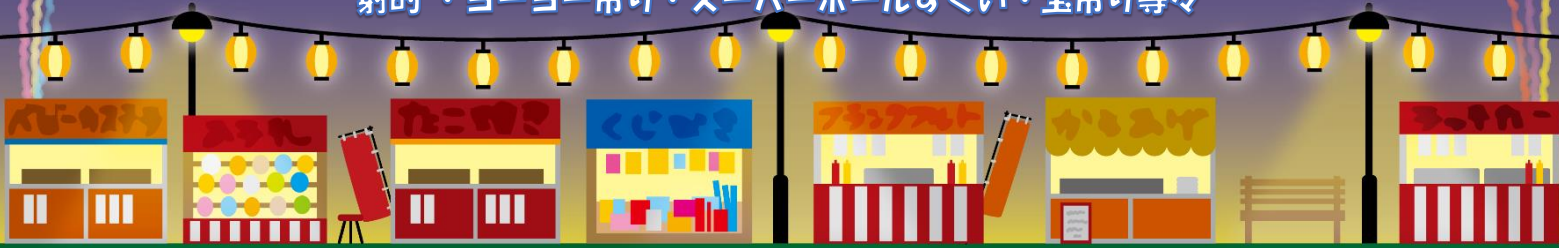
シーサイドガーデン縁日 8月13,14日 18:00~21:00 射的・ヨーヨー吊り・スーパーボールすくい・宝吊り等々